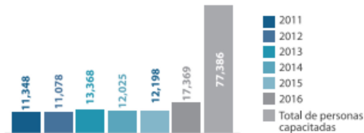
Imagen 1. Población atendida en cursos de capacitación en el trabajo.