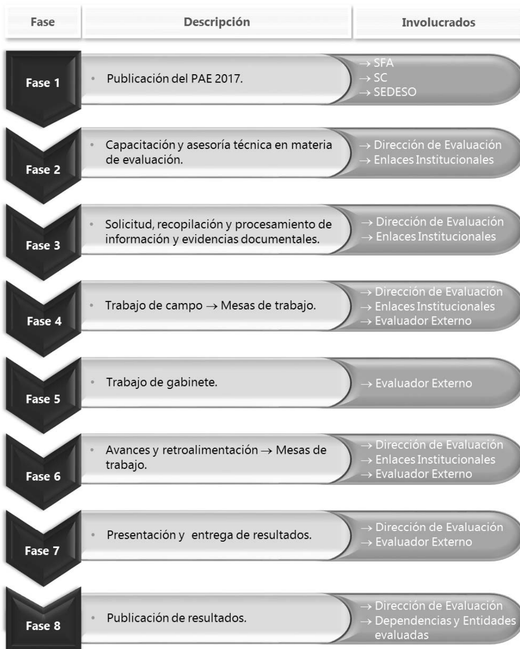
Esquema 1. Proceso de Evaluación Externa del Gasto Federalizado