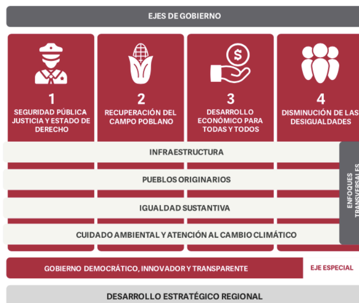
FIGURA 2. ESTRUCTURA DEL PROGRAMA ESTATAL DE DESARROLLO 2019-2024, DEL GOBIERNO DEL ESTADO DE PUEBLA

Fuente: Plan Estatal de Desarrollo 2019-2024 (Gobierno del Estado de Puebla, 2019)