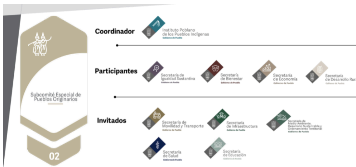
FIGURA 3. INTEGRACIÓN DEL SUBCOMITÉ ESPECIAL DE PUEBLOS ORIGINARIOS

Fuente: Secretaría de Planeación y Finanzas, 2019b