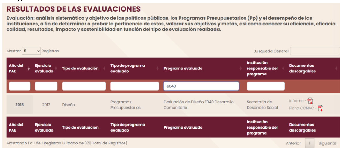
Imagen 2. Evaluaciones externas realizadas a la Secretaría de Bienestar.