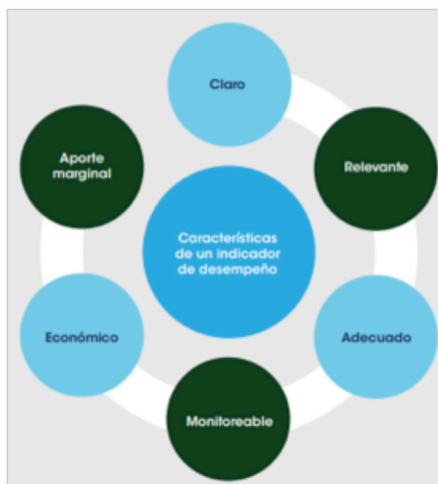
Imagen 1. Criterios de elaboración de indicadores