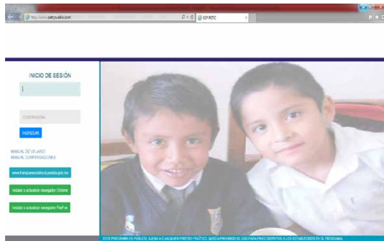
Ilustración 1. Portal Web PETC Puebla.

Fuente: Captura de pantalla del portal PETC Puebla, obtenida de: www.petcpuebla.com