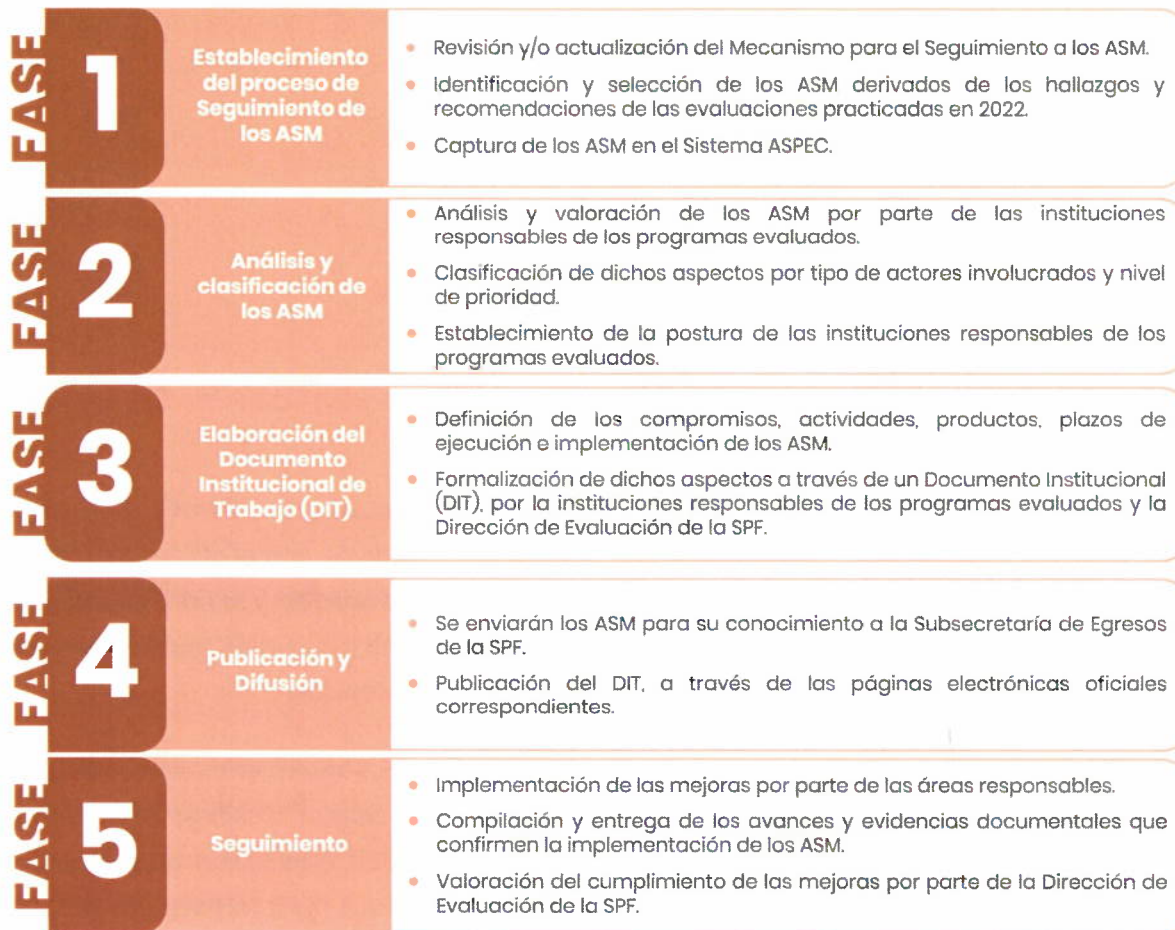
Figura 1. Proceso de Seguimiento a los ASM 2023

El proceso de seguimiento a los ASM es participativo, la Dirección de Evaluación de la SPF se vincula y coordina con los Enlaces Institucionales de Evaluación a través del Sistema ASPEC; con el propósito de que los ASM sean analizados, clasificados y retroalimentados, y que la formalización de estos, se lleve a cabo de forma consensuada mediante la firma del Documento Institucional de Trabajo (DIT).