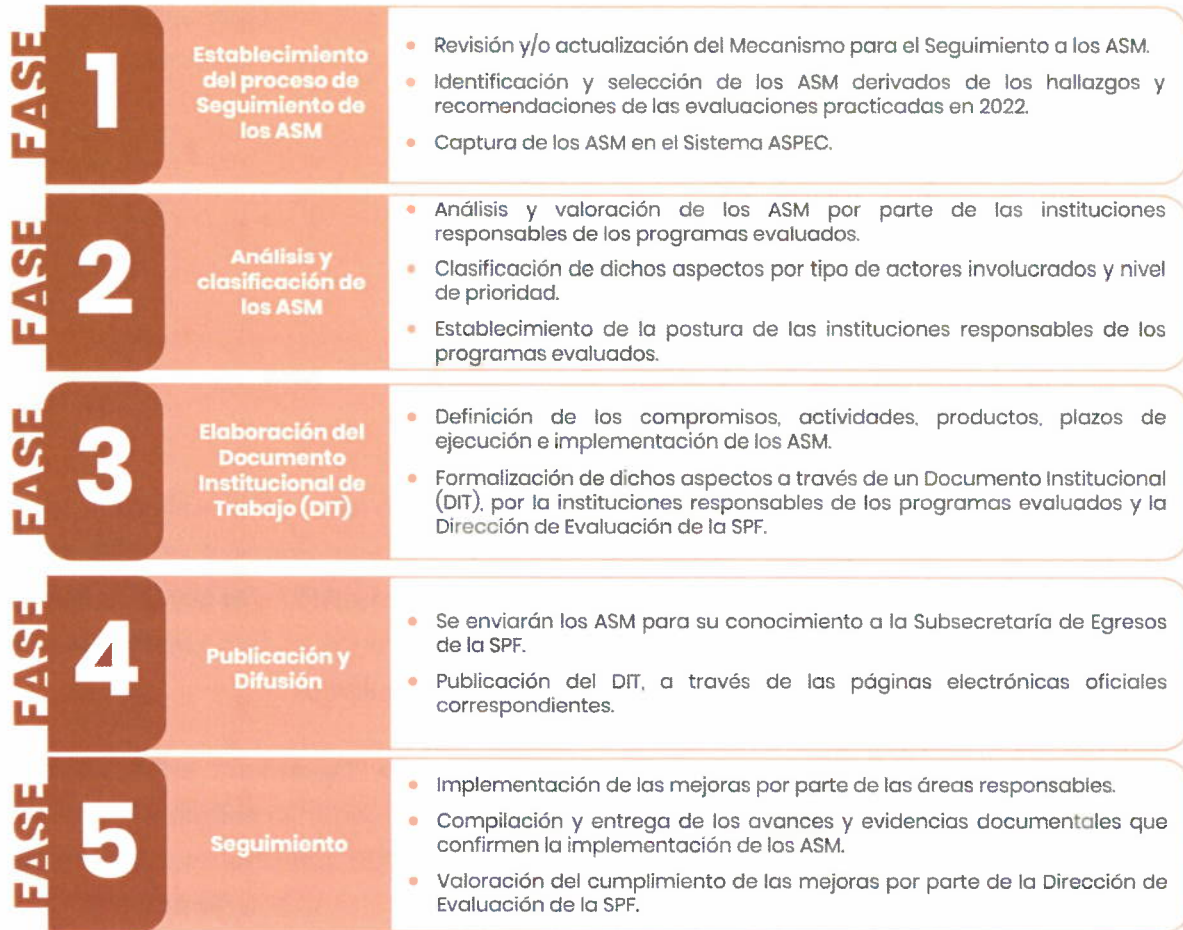
Figura 1. Proceso de Seguimiento a los ASM 2023