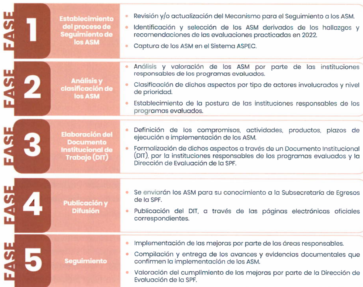
Figura 1. Proceso de Seguimiento a los ASM 2023

El proceso de seguimiento a los ASM es participativo, la Dirección de Evaluación de la SPF se vincula y coordina con los Enlaces Institucionales de Evaluación a través del Sistema ASPEC; con el propósito de que los ASM sean analizados, clasificados y retroalimentados, y que la formalización de estos, se lleve a cabo de forma consensuada mediante la firma del Documento Institucional de Trabajo (DIT).