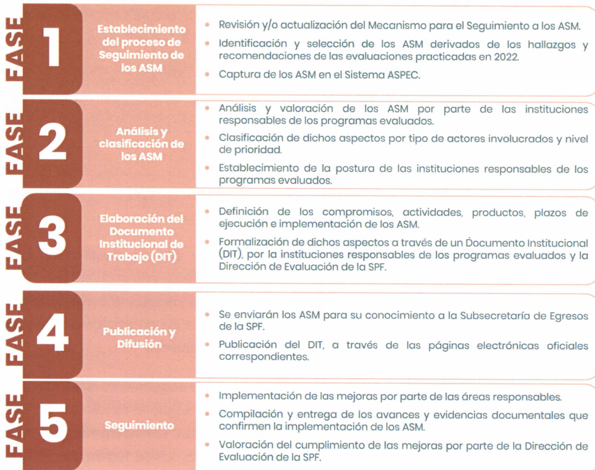
Figura 1. Proceso de Seguimiento a los ASM 2023

El proceso de seguimiento a los ASM es participativo, la Dirección de Evaluación de la SPF se vincula y coordina con los Enlaces Institucionales de Evaluación a través del Sistema ASPEC; con el propósito de que los ASM sean analizados, clasificados y retroalimentados, y que la formalización de estos, se lleve a cabo de forma consensuada mediante la firma del Documento Institucional de Trabajo (DIT).