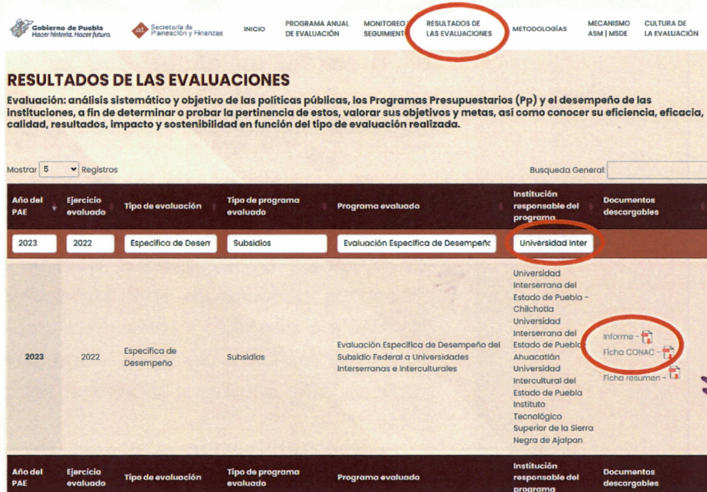
Imagen 1. Publicación de la evaluación del SFUII

Donde los datos que deberá de ingresar para consultar la evaluación se describen en la Tabla 1.