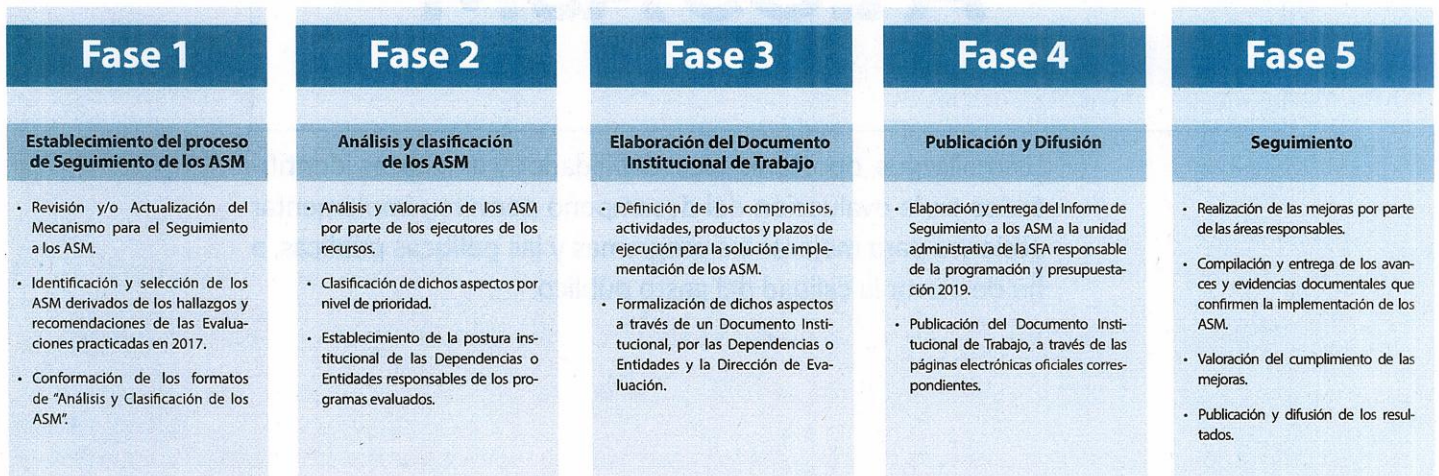
FIGURA 1. Proceso de Seguimiento a los ASM 2018

El proceso referido dio inicio con el envío de los formatos de Análisis y clasificación de los ASM, los cuales son el insumo para la integración del Documento Institucional de Trabajo (DIT), instrumento que cada Dependencia y Entidad participante suscribe para formalizar los ASM. Por último, el proceso considera el seguimiento y verificación del cumplimiento de los compromisos de trabajo que se establecieron en el DIT a fin de mejorar los Pp.