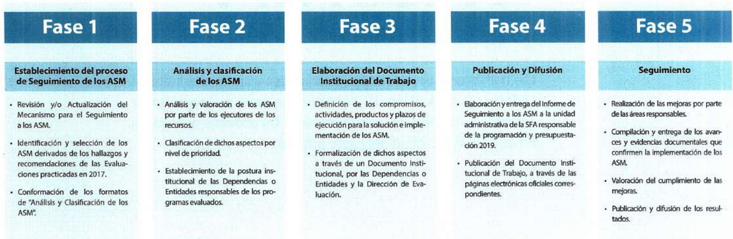
FIGURA 1. Proceso de Seguimiento a los ASM 2018

El proceso referido dio inicio con el envío de los formatos de Análisis y clasificación de los ASM, los cuales son el insumo para la integración del Documento Institucional de Trabajo (DIT), instrumento que cada Dependencia y Entidad participante suscribe para formalizar los ASM. Por último, el proceso considera el seguimiento y verificación del cumplimiento de los compromisos de trabajo que se establecieron en el DIT a fin de mejorar los Pp.