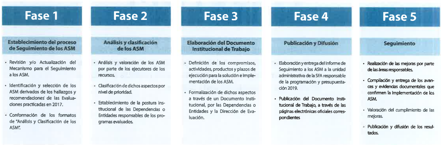
FIGURA 1. Proceso de Seguimiento a los ASM 2018

El proceso referido dio inicio con el envío de los formatos de Análisis y clasificación de los ASM, los cuales son el insumo para la integración del Documento Institucional de Trabajo (DIT), instrumento que cada Dependencia y Entidad participante suscribe para formalizar los ASM. Por último, el proceso considera el seguimiento y verificación del cumplimiento de los compromisos de trabajo que se establecieron en el DIT a fin de mejorar los Pp.