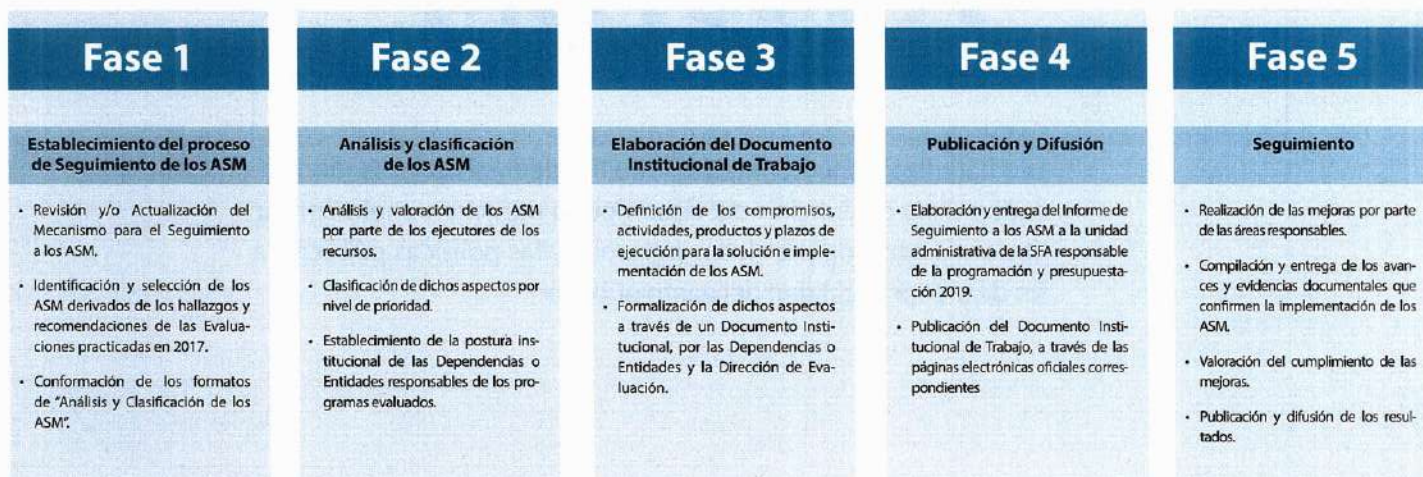
FIGURA 1. Proceso de Seguimiento a los ASM 2018

El proceso referido dio inicio con el envío de los formatos de Análisis y clasificación de los ASM, los cuales son el insumo para la integración del Documento Institucional de Trabajo (DIT), instrumento que cada Dependencia y Entidad participante suscribe para formalizar los ASM. Por último, el proceso considera el seguimiento y verificación del cumplimiento de los compromisos de trabajo que se establecieron en el DIT a fin de mejorar los Pp.