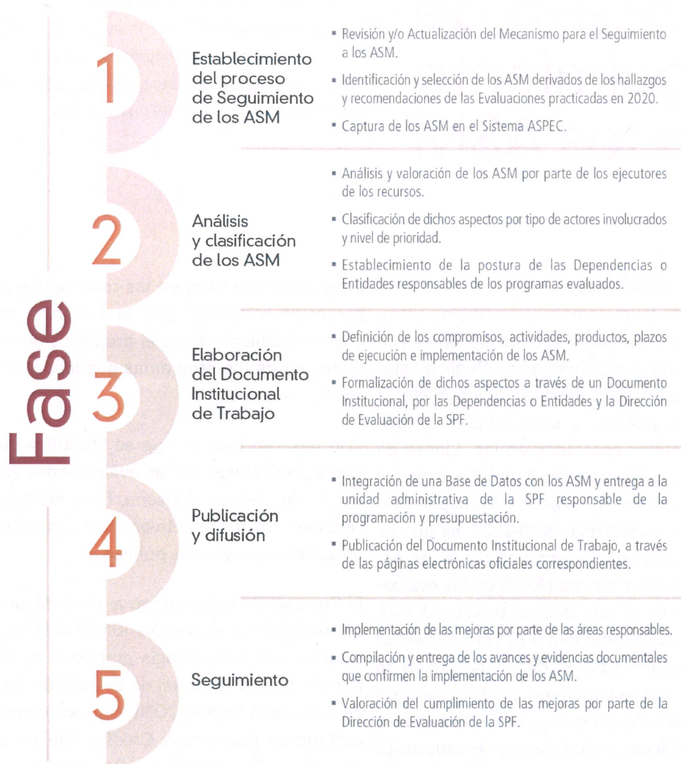
Figura 1. Proceso de Seguimiento a los ASM 2021.

El proceso de seguimiento de los ASM es participativo, la Dirección de Evaluación de la Secretaría de Planeación y Finanzas se vincula y coordina con los Enlaces Institucionales de las dependencias y entidades a través sistema ASPEC; con el propósito de que los ASM sean analizados, clasificados y retroalimentados, y que la formalización de estos, se lleve a cabo de forma consensuada.