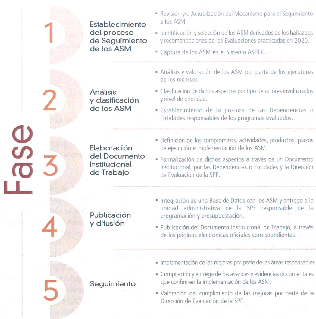
Figura 1. Proceso de Seguimiento a los ASM 2021.

El proceso de seguimiento de los ASM es participativo, la Dirección de Evaluación de la Secretaría de Planeación y Finanzas se vincula y coordina con los Enlaces Institucionales de las dependencias y entidades a través sistema ASPEC; con el propósito de que los ASM sean analizados, clasificados y retroalimentados, y que la formalización de estos, se lleve a cabo de forma consensuada.