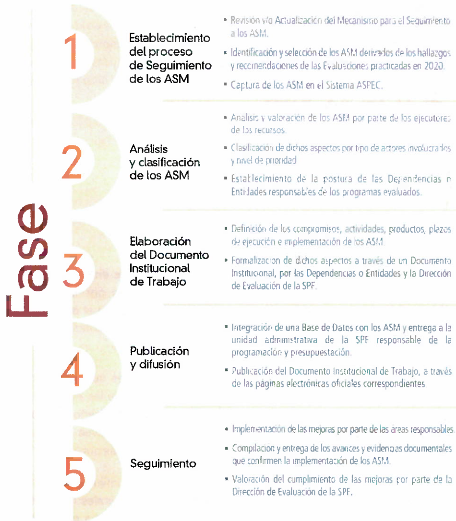
Figura 1. Proceso de Seguimiento a los ASM 2021.

El proceso de seguimiento de los ASM es participativo, la Dirección de Evaluación de la Secretaría de Planeación y Finanzas se vincula y coordina con los Enlaces Institucionales de las dependencias y entidades a través sistema ASPEC; con el propósito de que los ASM sean analizados, clasificados y retroalimentados, y que la formalización de estos, se lleve a cabo de forma consensuada.