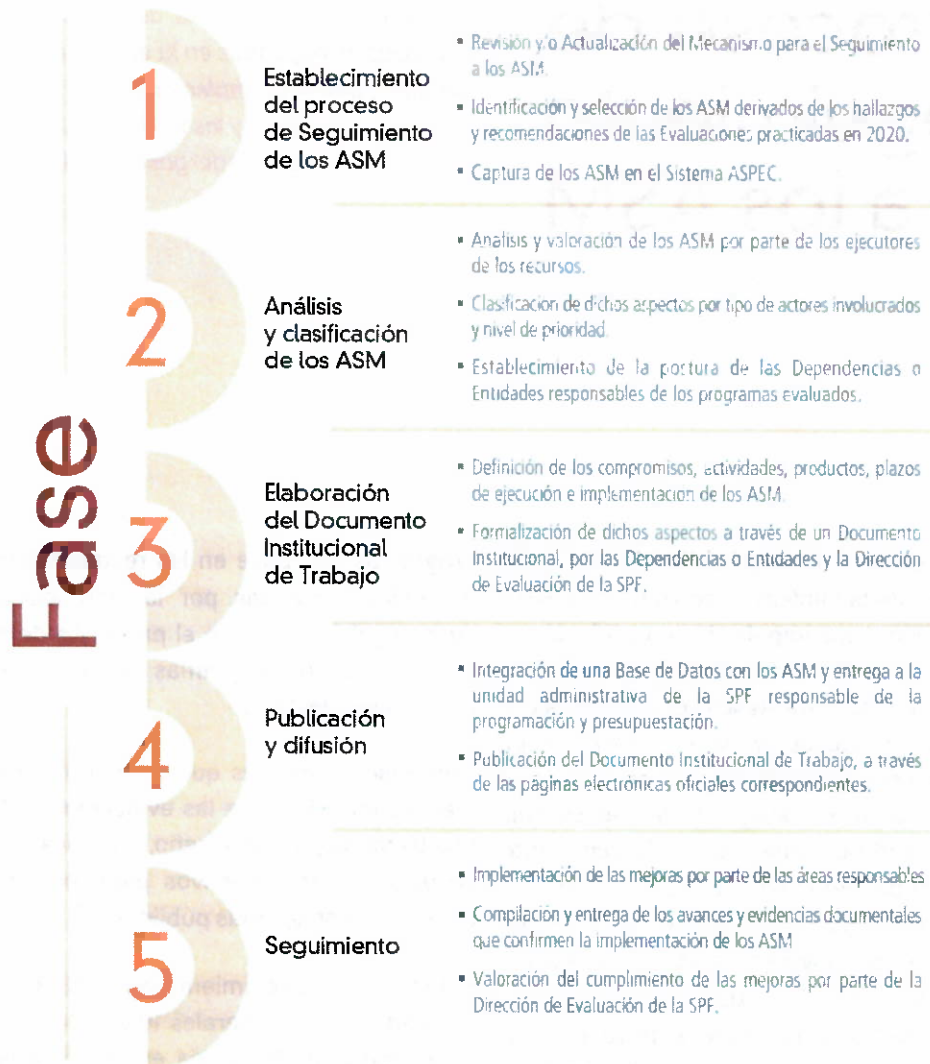
Figura 1. Proceso de Seguimiento a los ASM 2021.

El proceso de seguimiento de los ASM es participativo, la Dirección de Evaluación de la Secretaría de Planeación y Finanzas se vincula y coordina con los Enlaces Institucionales de las dependencias y entidades a través sistema ASPEC; con el propósito de que los ASM sean analizados, clasificados y retroalimentados, y que la formalización de estos, se lleve a cabo de forma consensuada.