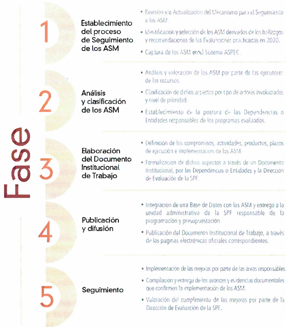
Figura 1. Proceso de Seguimiento a los ASM 2021.

El proceso referido dio inicio con el envío de usuario y contraseña de acceso al sistema ASPEC a los Enlaces Institucionales de Evaluación, con el propósito de que los ASM sean analizados y clasificados, para su posterior formalización. Por último, el proceso considera el seguimiento y verificación de las acciones que se establecieron en el DIT a fin de mejorar los programas públicos.