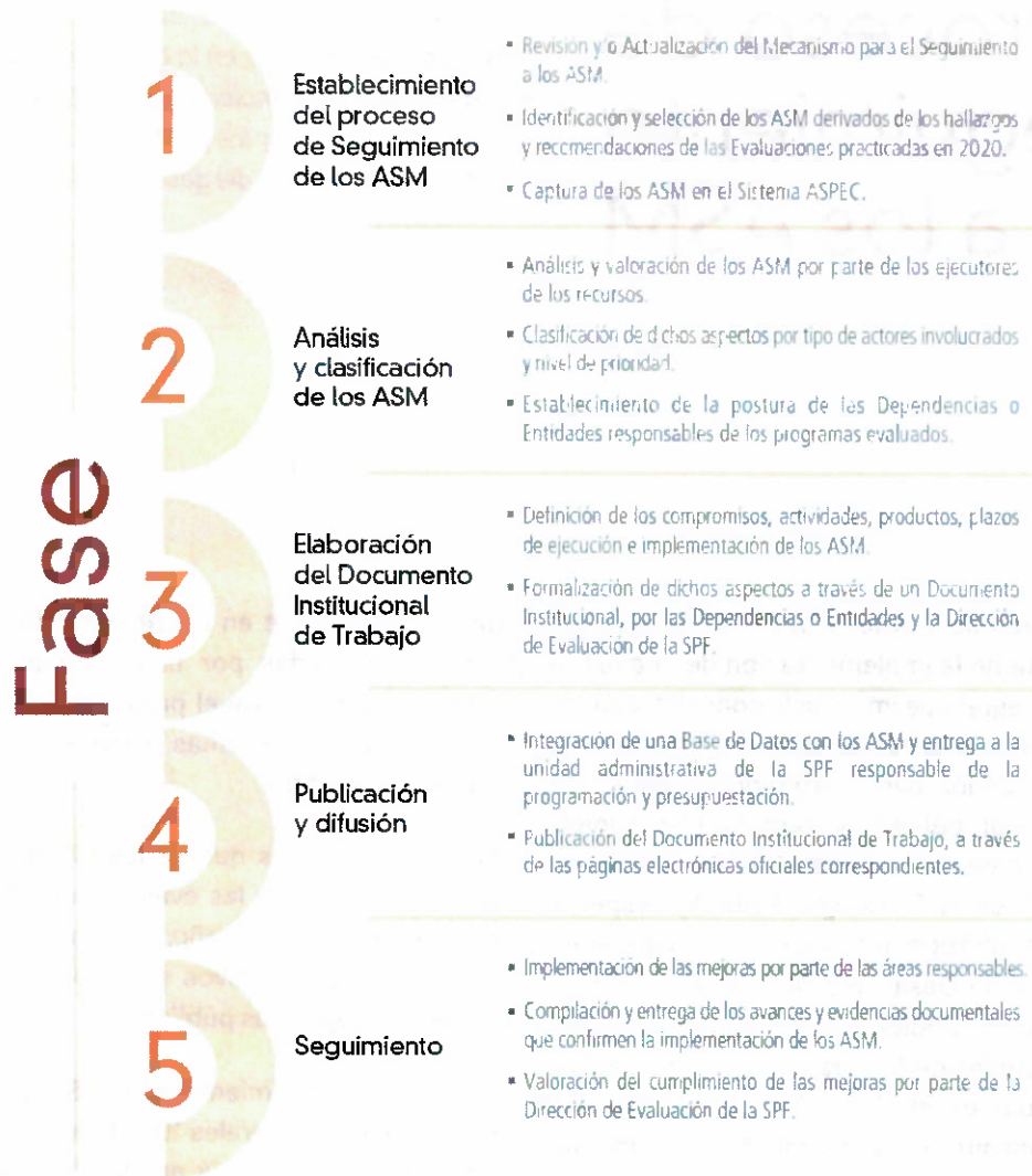
Figura 1. Proceso de Seguimiento a los ASM 2021.

El proceso de seguimiento de los ASM es participativo, la Dirección de Evaluación de la Secretaría de Planeación y Finanzas se vincula y coordina con los Enlaces Institucionales de las dependencias y entidades a través sistema ASPEC; con el propósito de que los ASM sean analizados, clasificados y retroalimentados, y que la formalización de estos, se lleve a cabo de forma consensuada.