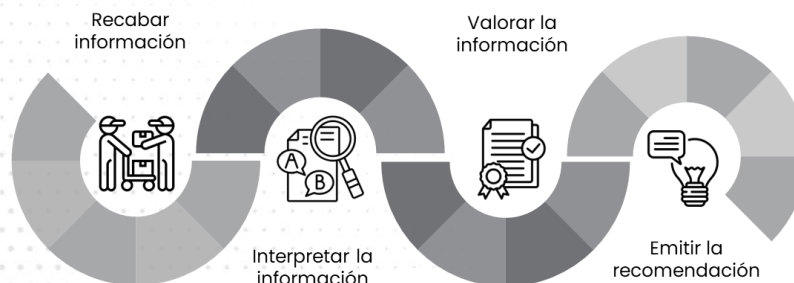
Ilustración 3 Trayectoria analítica para emitir una recomendación.