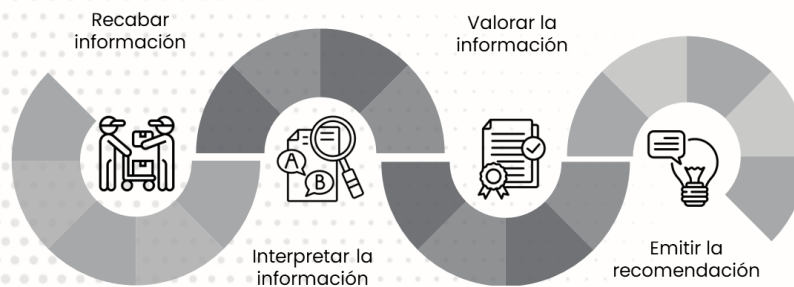
Ilustración 2 Trayectoria analítica para emitir una recomendación.