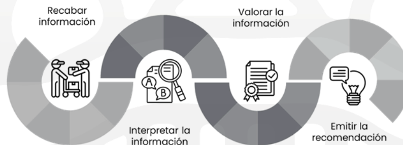
Ilustración 5 Trayectoria analítica para emitir una recomendación.