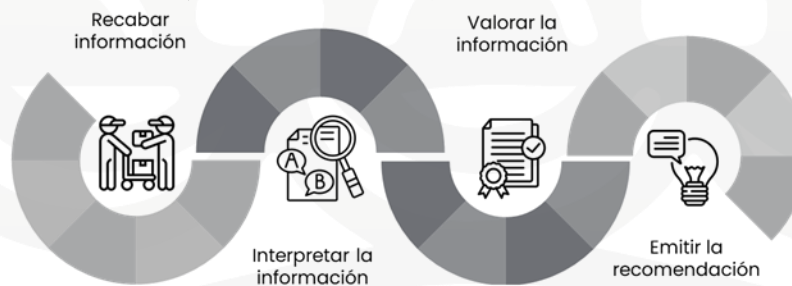
Ilustración 3 Trayectoria analítica para emitir una recomendación.